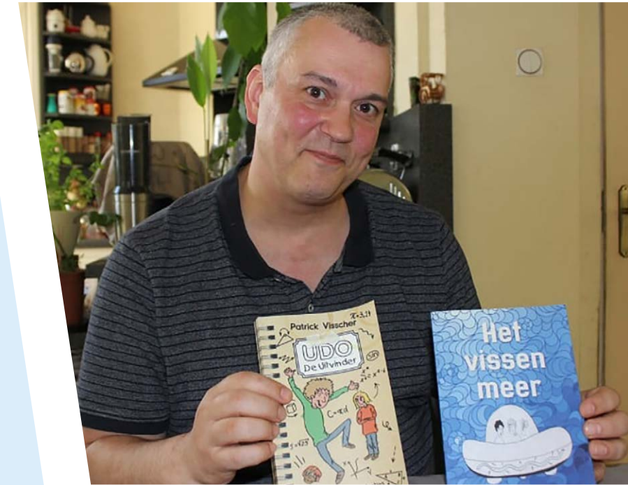
Onlangs verscheen het kinderboek Udo de Uitvinder met tekeningen van Ferry Segers.

Ik ben een tijd geleden door de ellende waar ik in zat begonnen met schrijven. Dit mondde uit in een boek. Daarna begon ik mijn oude hobby met tekenen weer op te pikken en sinds een jaar teken ik wekelijks een strip in de lokale krant. Zo heb ik uit een negatieve situatie toch iets moois overgehouden. Ik koester daarom ook de moeilijke tijden die ik gehad heb. Ze hebben me ook dicht bij mijn naasten gebracht.