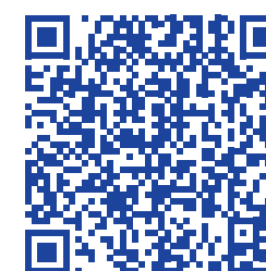
Podcast 'En toen werd ik mantelzorger' vanaf 10 november te beluisteren.

'Het mooie van zo'n podcast is dat het een naslagwerk is dat online blijft. Zo kunnen heel veel mensen ook echt wat aan deze verhalen hebben, ook later na de uitzendingen. Er zijn namelijk zoveel mantelzorgers die tegen dezelfde problemen aanlopen. Het zou mooi zijn als ze hiervoor tips kunnen krijgen, maar alleen al de herkenning kan al zo waardevol voor ze zijn.'